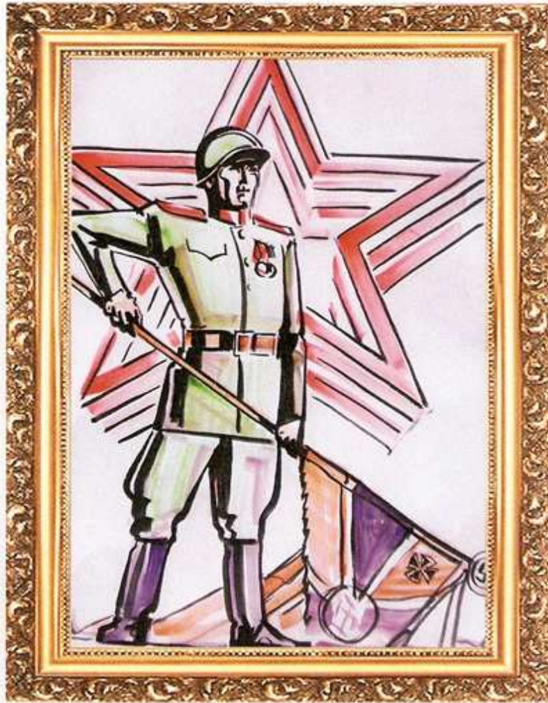
Я. Бужинлхам 4 «Б» класс