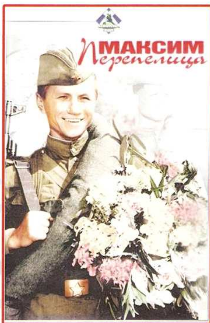
Афиша к фильму