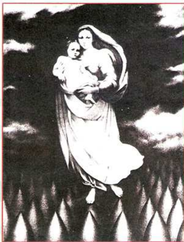
«Антивоенный плакат» Михайлов (Пунегов) В.