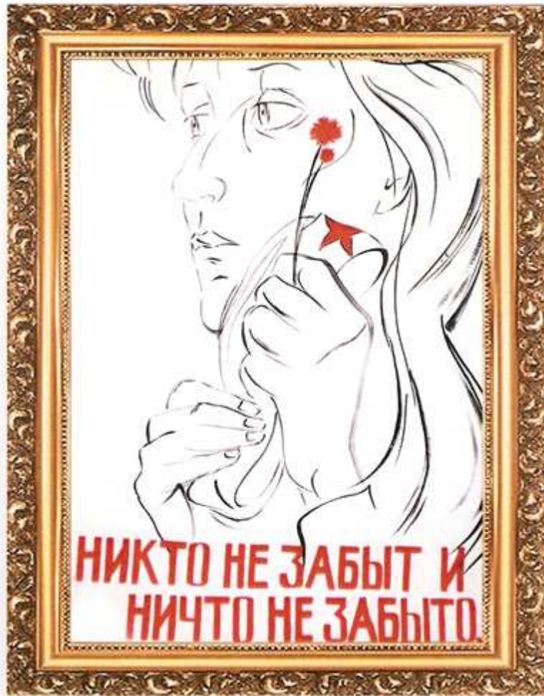
редколлегия 9 «Б» класса