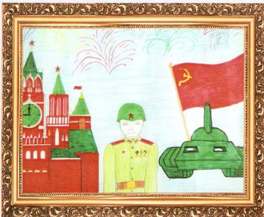
Б. Энэбиш 2 «Б» класс